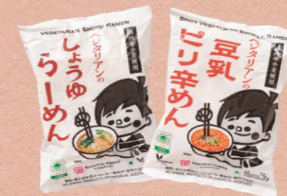
A 【BIO-RAL】 ベジタリアンの豆乳ピリ辛めん 321 円 ベジタリアンのしょうゆらーめん 170 円

動物性原材料不使用の即席麺。豆乳ピリ辛めんは、胡麻の濃厚な味わい・ラー油の程よい辛み・豆乳の甘みが織りなす本格的な1品。しょうゆらーめんは、あっさりだけど奥深い出汁が効いている。ジャンクなラーメンなのにギルトフリー！