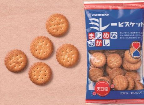
B 【おかしのまちおか】 まじめミレービスケット 172 円

シールやネット、ザルまで、本物のフルーツさながらの容器の中には、日本各地の名産フルーツを使ったみずみずしいゼリーが。果肉もごろごろと贅沢に入っていて、食感も楽しい。キンキンに冷やして食べたい夏のごちそうスイーツ。