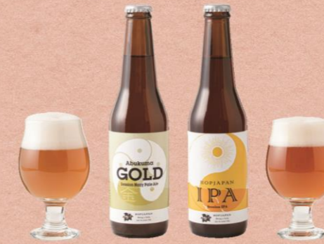
D 【久世福商店】 右 / Hopjapan IPA 660 円 左 / Abukuma GOLD 680 円

長年愛され続けてきた高知県生まれの人気おやつ「ミレービスケット」。さまざまなフレーバーが登場する中、やっぱり手にとりたくなるのが定番のこちら。優しい甘みとキリッとした大粒の塩がベストマッチ。食べる手が止まらないこと必至！