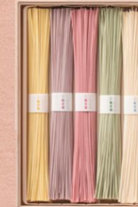
D 【久世福商店】 手延べ色そうめん 5束入り 1,512 円

人気の芋けんぴに塩のアクセントをプラスした塩けんぴ。高知県・室戸海洋深層水の塩を使い、コクのある塩味が芋の甘さを程よく引き立て、止まらなくなる味わい。鞆にこっそりしのばせておきたくなるコンパクトサイズなのも嬉しい。