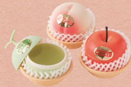
F 【Marché de Bleuét plus】 フルーツアラモード 各 648 円

上野御徒町駅、上野広小路駅、御徒町駅すぐのPARCO_ya上野内B1Fにあるグロサリーフロア「遊食回廊」から、夏のおうち時間のお供にぴったりの商品を編集部が厳選しました。お出かけが億劫になる暑い日は、こだわりグルメと一緒に涼みましょう