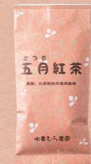
E 【こだわりや】 国産紅茶 五月 972 円

動物性原材料不使用の即席麺。豆乳ピリ辛めんは、胡麻の濃厚な味わい・ラー油の程よい辛み・豆乳の甘みが織りなす本格的な1品。しょうゆらーめんは、あっさりだけど奥深い出汁が効いている。ジャンクなラーメンなのにギルトフリー！