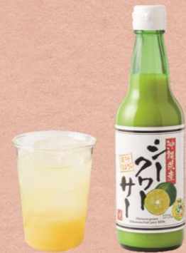
C 【カルディコーヒーファーム】 沖縄県産シークワサー 997 円

福島県田村市産のホップによるクラフトビール。Abukuma GOLD(左)は、ホップによる鮮烈なトロピカル・シトラスアロマが心地よい。口当たりもシルキーで夏にぴったりの1本。Hopjapan IPA(右)は、苦味を抑えたバランスのいいIPA。