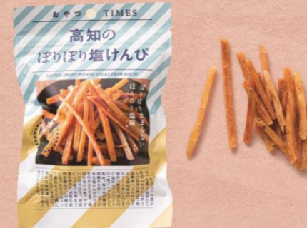
F 【Marché de Bleuét plus】 高知のぼりぼり塩けんぴ 234 円

穏やかな酸味と優しい苦みが特徴的なシークワサー100%果汁。しっかり冷やした炭酸水で割れば、夏らしき満点のフレーバーのジュースに。また、刺身や焼き魚、ドレッシングなどお酢の代用としてもうってつけて使い勝手抜群。