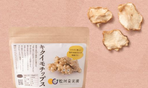
E 【こだわりや】 キクイモチチップス 465 円

奈良県桜井市にある創業170余年「池利」の手延べそうめん。代々受け継がれてきた製法で丁寧に作られたそうめんは、しっかりとしたコシと絶妙な歯切れが抜群。紫芋、梅、青しそ、カボスの淡い色も施され、食卓を涼やかに彩ってくれる。